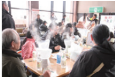
温まるカレー作り

災害時以外にも、キャンプに行ったときや普段の調理にも使えるので無駄がありません。