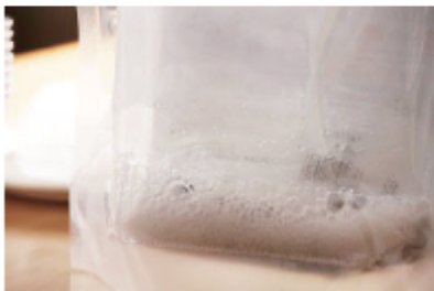
発熱中は蒸気がでます